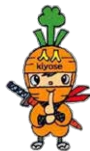
ニンニンくん 清瀬市