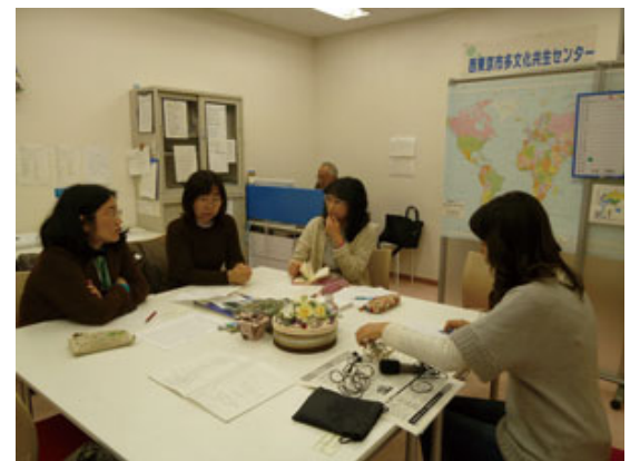
FM西東京の取材風景 (イングリッシュ多文化共生センターにて)

ホームページを見た方から翻訳協力の申し出が複数ありました。3月14日には市のホームページ、4月1日号市報、さらにホームページ担当と多言語部会がFM西東京の取材を受け、4月9日の番組で紹介されました。この紹介を受け、アクセス数が通常時の8倍に跳ね上がった日もあります。これからも、夏の計画停電など、少しずつ更新しながら続けてゆこうと思います。