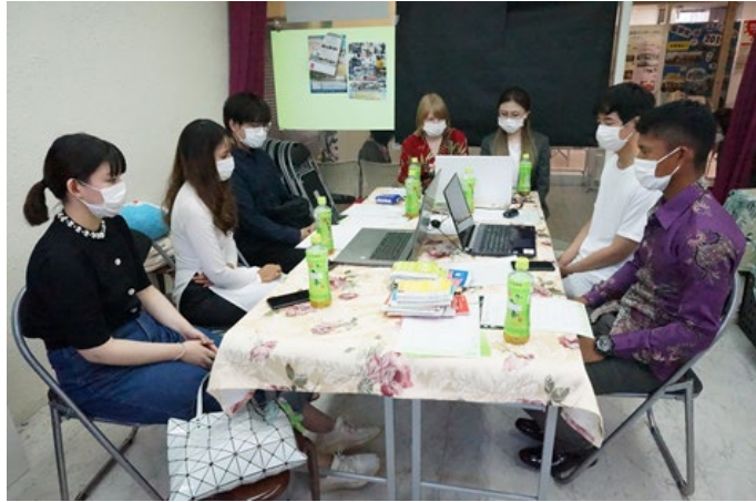
審査結果待ちはドキドキ