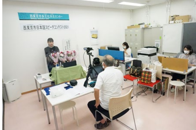
オンライン配信をしている発表会場