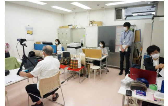
発表を見守るスタッフ・市職員