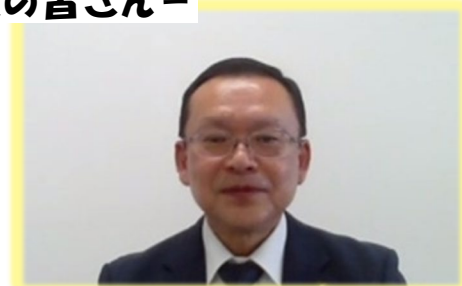
西東京市長 池澤 隆史さま