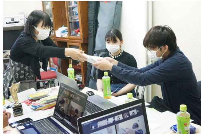
三賞の授与につづき、 皆さんの健闘を称え、全員に敢闘賞