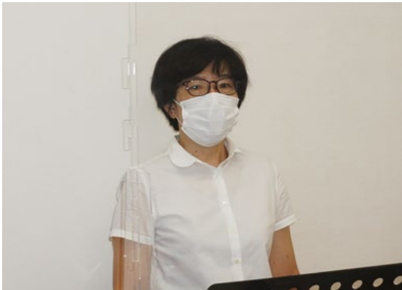
緊張の面持ちの実行委員長