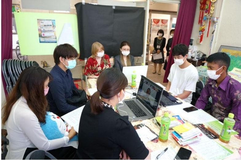
控室で市長のご挨拶を聞く発表者たち