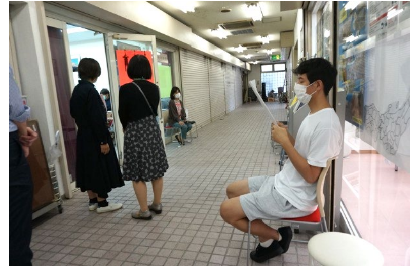
次の発表を待つ発表者と控室を見守るスタッフ