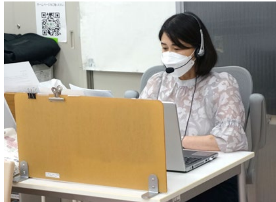
入念な準備でのぞむ司会者